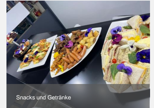
Snacks und Getränke