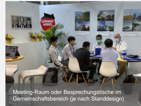
Meeting-Raum oder Besprechungstische im Gemeinschaftsbereich (je nach Standdesign)