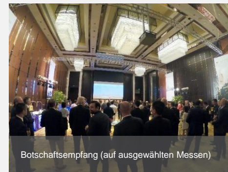
Botschaftsempfang (auf ausgewählten Messen)