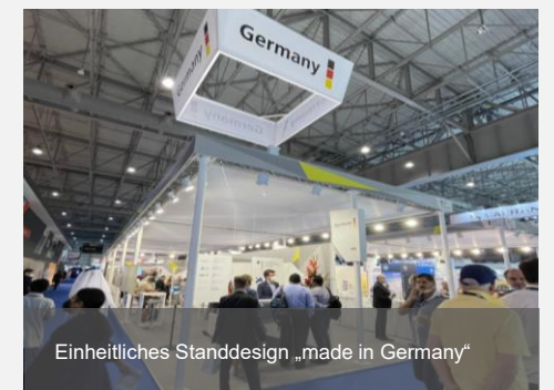
Einheitliches Standdesign „made in Germany“