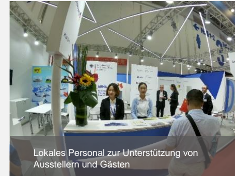
Lokales Personal zur Unterstützung von Ausstellern und Gästen