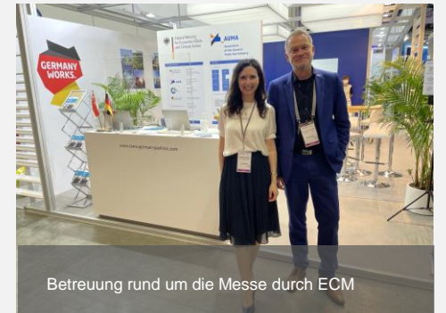
Betreuung rund um die Messe durch ECM